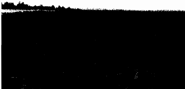
Figura 3. Plantație de Miscanthus pe steril, anul I de vegetație